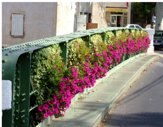
Parapets de ponts ...