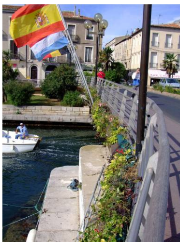
Tabliers de ponts...